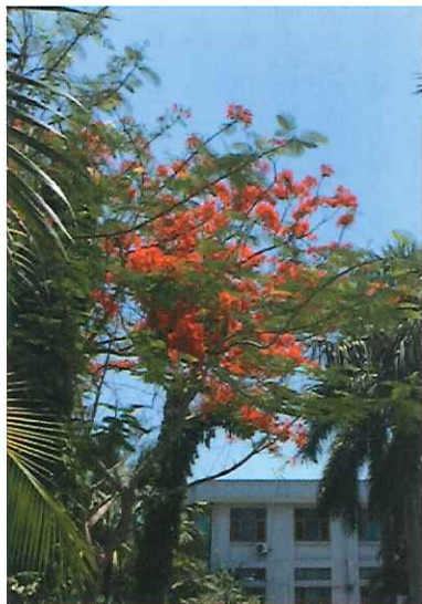
ミャンマーの5月。朱色の鳳凰花が咲き誇っていた=ヤンゴン医療技術大学構内

5月に4日間、視察団に参加させていただいた。これは、初めての「ミャンマー観察記」です。