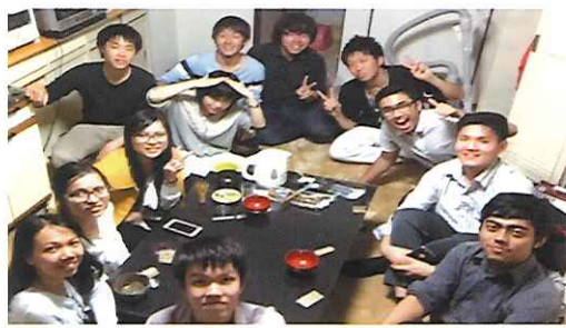
④ グループ学習の合間に岡山大学医学部 ⑤ たこ焼きパーティーの後で